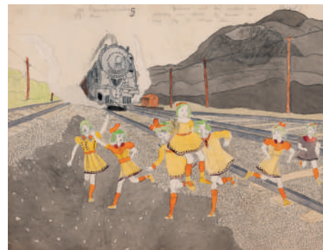
Henry Darger Jenny and Her Sisters are Nearly Run Down by Train... , sans date Collection Graffe © 2022 Kioko Lerner / Adagp, Paris